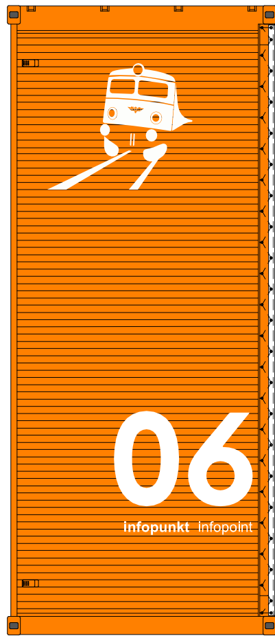
3 // SIDE