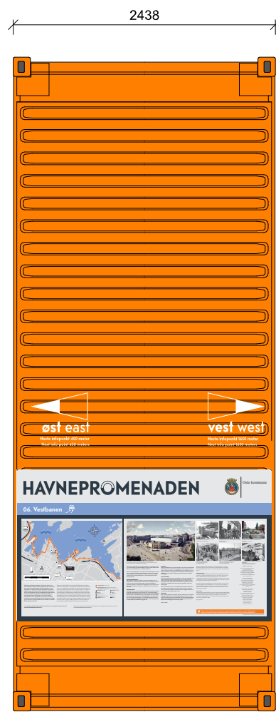
2 // TAK